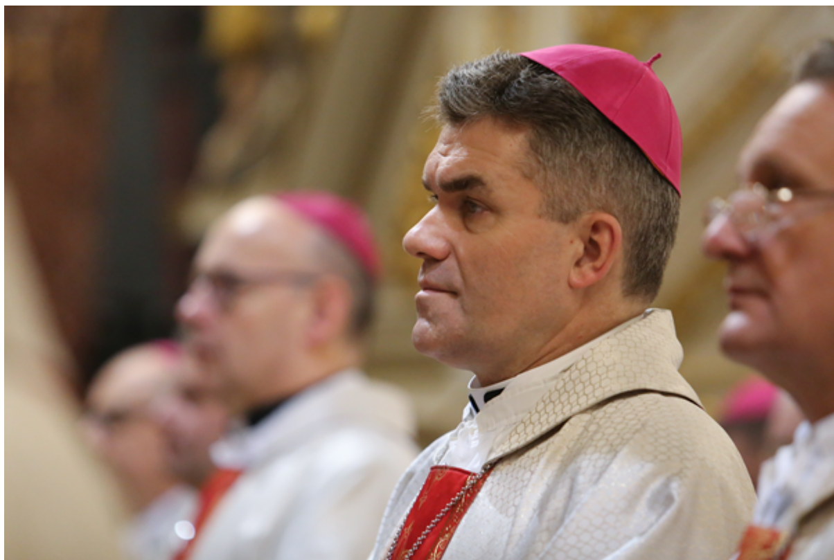
Biskup Zbigniew Zieliński Zawołanie biskupie: Ut unum sint (Aby byli jedno) J 17, 21

Biskup Zbigniew Zieliński, dotychczasowy Biskup Koadiutor został Biskupem Diecezji Koszalińsko-Kołobrzeskiej. Decyzję Ojca Świętego Franciszka ogłosiła dziś, 2 lutego 2023 roku, w południe Stolica Apostolska.